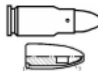
Рис. 1. Конструкция патрона, гильзы и пули к нему: 5,45-мм малокалиберный пистолетный патрон центрального боя (МПЦ): 1 – свинцовый сердечник; 2 – стальной сердечник

В статье содержатся технические характеристики патрона, сведения о морфологии порохов, а также перечень моделей оружия, для которых патрон является штатным.